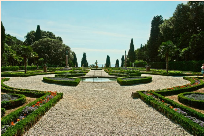
Ottobre 2010, il parterre

La mostra presenta una serie di fotografie amatoriali scattate nel parco di Miramare tra il 2013 e il 2015 per documentare le condizioni di degrado della vegetazione, degli arredi e delle strutture, segnalando anche