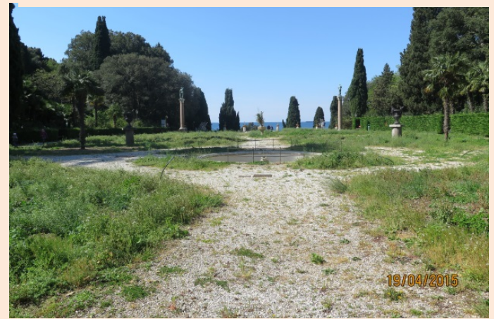
Aprile 2015, il parterre

Le fotografie, per quanto numerose, sono solo esemplificative e non mostrano tutti i casi di degrado.